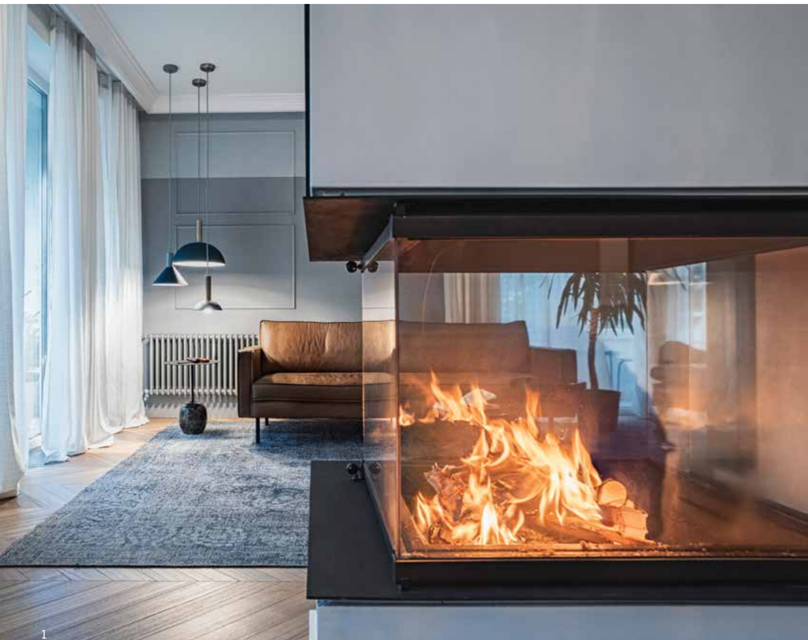
1. Забележителна е три-странната камина с изглед към дневната и трапезарията, изработена по проект (Камини Ринков). 2, 3, 4. Предизвикателство беше кухнята, която успяхме функционално да оформим само с шкафове под работния плот, а аспираторът на

котлоните вградихме в плота. Единствената висока част е хладилникът, който се прикрива от облицовката с декоративни елементи към входното антре. Цялото обзавеждане на трапезарията и декоративните осветителни тела са от Sofia Design District.